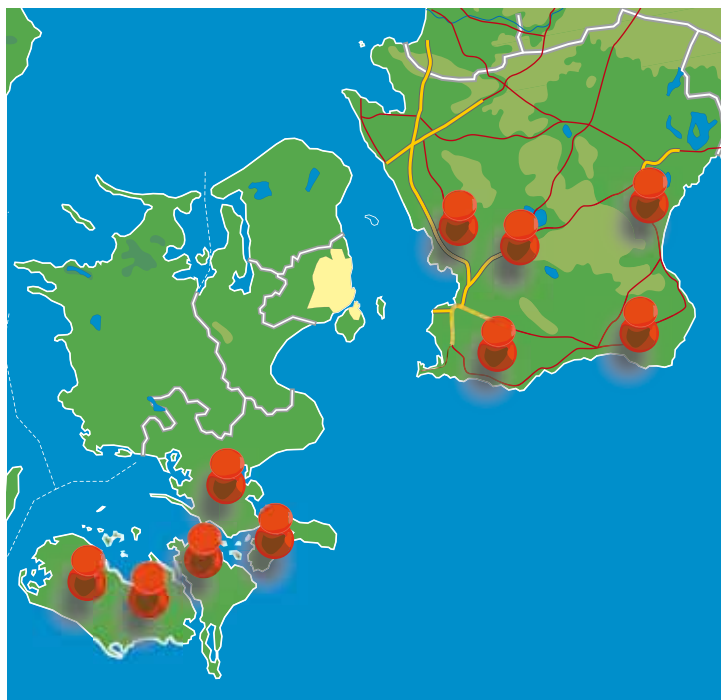
5T-projektet startar 2014 på fem gårdar i Danmark och fem i Sverige. Tanken är att de allra flesta betodlarna ska känna igen sina hemförhållanden på åtminstone någon gård.

säsongen och sätter siffror på tillväxt, slutskörd och skördebegränsande faktorer. Gapet mellan verklig och möjlig skörd tror vi kan minskas.